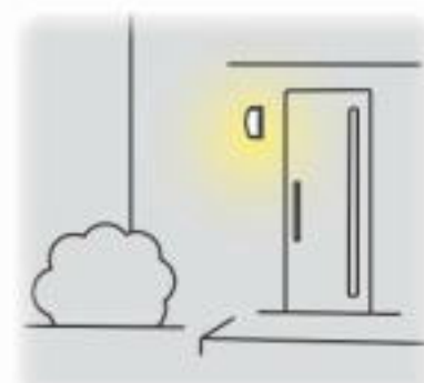
④人が離れると約1分後にほんのり点灯に戻ります。