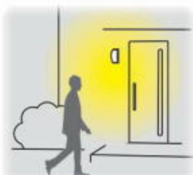
③人が来ると100%点灯します。