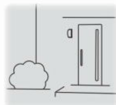
④人が離れると約1分後に消灯します。