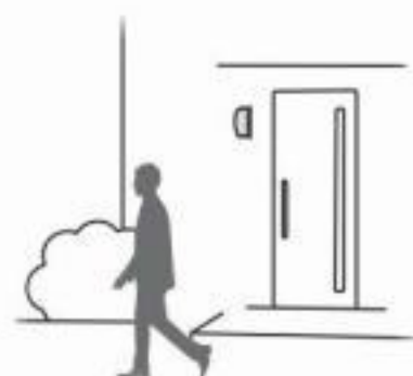
①周囲が明るい間は明暗センサで作動しません。

タイマー付調光モードは、昼間の明るい間は明暗センサで作動しません。暗くなるとタイマー機能で設定時間、ほんのり点灯になります。人を感知すると100%点灯し、人が離れると約1分後にほんのり点灯に戻ります。タイマーが終了すると消灯します。(周囲が暗い間は消灯状態でも人を感知すると100%点灯、人が離れると約1分後に消灯します。)