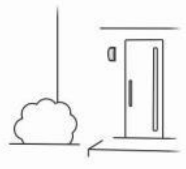
⑤周囲が明るくなると明暗センサで作動しません。