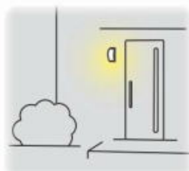
②周囲が暗くなるとほんのり点灯します。