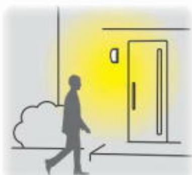
③人が来ると100%点灯します。