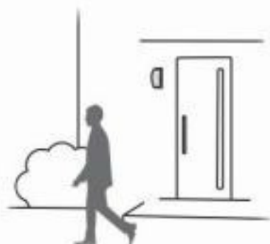
①周囲が明るい間は明暗センサで作動しません。

調光モードは、昼間の明るい間は明暗センサで作動しません。暗くなるとほんのり点灯し、人がセンサの感知エリアに入ると100%点灯状態になります。人がセンサの感知エリア外に立ち去ると約1分後に再びほんのり点灯に戻ります。