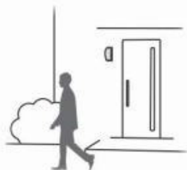
①周囲が明るい間は明暗センサで作動しません。

ON-OFFモードは、昼間の明るい間は明暗センサで作動しません。暗くなると人感センサが待機中になり、人が来ると100%点灯。人が離れると約1分後に消灯します。